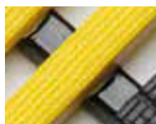
Černo/žlutá Bezpečnostní pruhy